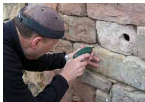
Fig. 10 : Il foro di entrata è piazzato in uno degli angoli superiori affinché i piccoli siano protetti dal maltempo.

Punto 6. Incollare la pietra di copertura sulla cornice in legno.