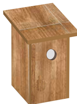
Fig. 6: Nido fissato verticalmente. Parete dietro (37 x 26 cm), pareti laterali con angoli (37-33 x 26 cm), parete davanti (26 x 33 cm), foro (6 cm), piano (28 x 28 cm), tetto (34 x 34 cm) Queste misure sono indicative possono essere adattate secondo la situazione.

Raccomandiamo di non fissare il tetto o la parete dietro se non in pochi punti, per poter aprire facilmente il nido per la pulizia. Il foro di entrata è situato su uno degli angoli superiori. I nidi sono installati orizzontalmente per far sì che i piccoli siano protetti dalle intemperie e abbiano più spazio (le upupe depongono fino a 10 uova). Il fondo del nido è ricoperto da segatura o legno decomposto. Se non sono disponibili cassette o costruzioni simili, le cassette nido possono essere fissate agli alberi. A causa della concorrenza con gli storni, conviene chiedere consiglio a un esperto/a dell'upupa della regione. I nidi esterni devono avere un tetto pendente per permettere alla pioggia di colare.