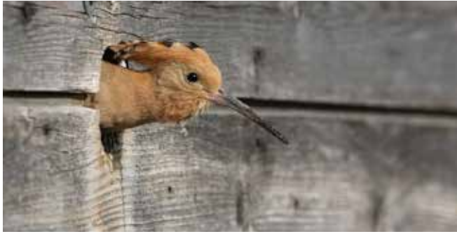
Fig. 4: Un'upupa guarda fuori dal suo nido.

L'upupa approfitta delle misure prese per altre specie come la coltivazione dei prati estensivi fioriti, siepi, boschetti, piccole strutture, ecc. Le misure di conservazione specifiche sono più difficili da formulare e riguardano soprattutto una migliore accessibilità al nutrimento e l'offerta di siti di nidificazione. Uno sfalcio alternato o la creazione di superfici di suolo aperto rendono le prede più accessibili. Nel Vallese, la Stazione ornitologica svizzera e l'Università di Berna sono riuscite a favorire l'upupa installando cassette di nido.