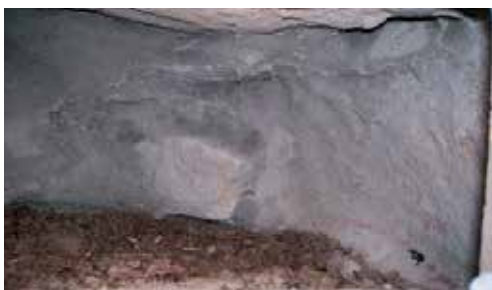
Fig. 8: Interno cementato. Importante: l'acqua deve poter colare e non inondare la cavità.

Punto 3. Stabilizzare il retro della cavità con piccole pietre. Diluire la malta e cementare l'interno a parte il pavimento con l'aiuto di una spugna morbida. Gli specialisti dei muri a secco possono costruire nicchie senza malta se sono assolutamente certi che anche in caso di forti piogge, l'acqua non entrerà nel nido.