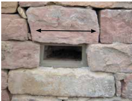
Fig. 7: il „tetto“ (freccia nera) deve essere più lungo della nicchia sui due lati (punto 4 già effettuato in questa foto).

Inserire una nicchia a posteriori in un muro già esistente necessita della supervisione di un esperto/a di muri a secco e di un ornitologo, di solito la persona che ha costruito il muro in questione. Cercate un posto poco visitato e una pietra facilmente asportabile rispetto alle altre. Non si può trovare una pietra removibile in tutti i muri. In alcuni casi, una pietra si deve fendere o smontare il muro dall'alto, mettere una pietra come tetto e ricostruire il muro.