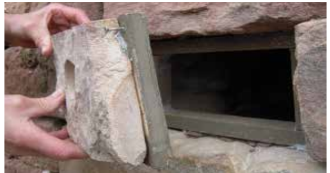
Fig. 9 : Gli angoli delle pietre di copertura sono tagliati per piazzare le viti.

Arrotondare gli angoli della pietra per piazzare le viti successivamente (Fig. 9). Fare il foro di entrata del diametro di 5-6 cm con l'aiuto di una punta a diamante. Il foro di entrata non è piazzato nel centro esatto, ma verso un lato lasciando almeno 5 cm (Fig. 9).